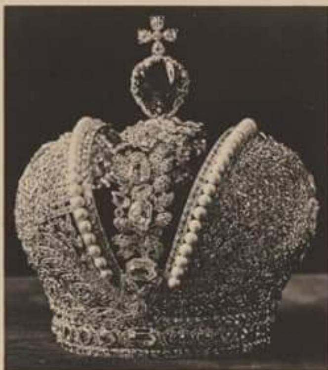
Корона ЕГО ИМПЕРАТОРСКАГО ВЕЛИЧЕСТВА.