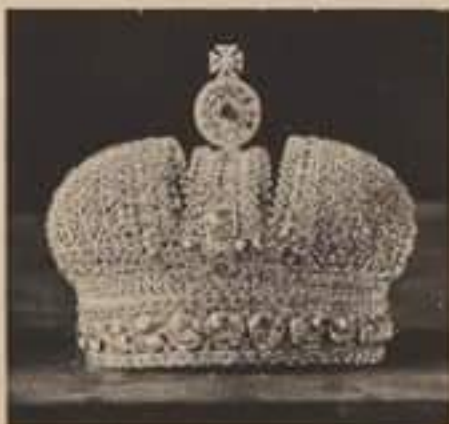
Корона Ея ИМПЕРАТОРСКАГО ВЕЛИЧЕСТВА Государыни Императрицы АЛЕКСАНДРЫ АЛЕКСАНДРОВНЫ.