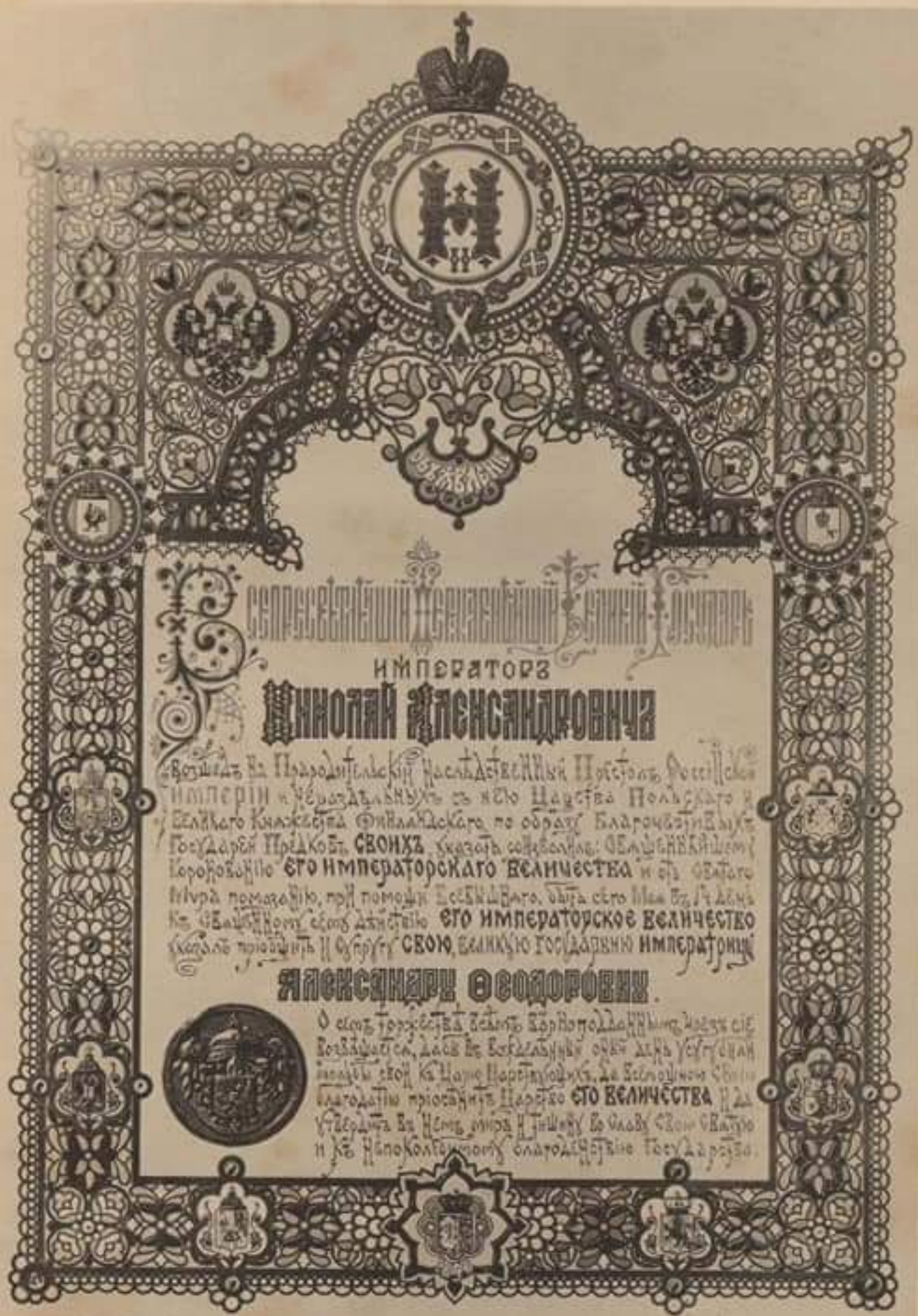
Объявленіе, розданное въ Москвѣ Герольдамп, о днѣ Священнаго Коронованія Царя Императорскихъ Величествъ.